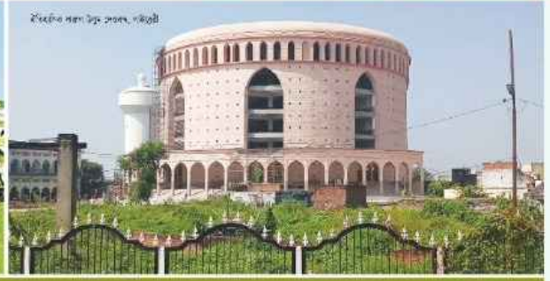
ইসলামিক স্কলারশিপ সেন্টার, পলিটেকনি