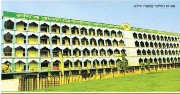
জামি'আ রাহমানিয়া আরাবিয়া মাদরাসা